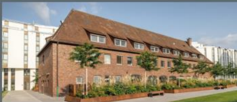
Erlanger Höfe B2 in Erlangen