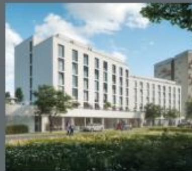
Donau Side in Ingoldstadt

WIR SIND IHR ZUVERLÄSSIGER PROJEKTENTWICKLER UND BAUTRÄGER AUS ERLANGEN