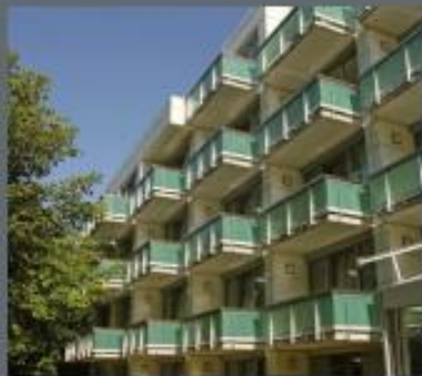
Flaucher Auen in München